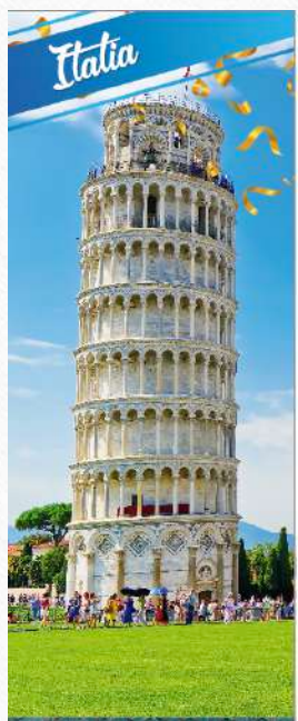
Propuesta 1 (paisajes)