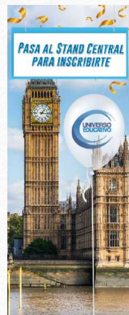
Propuesta 2 (frases UE)